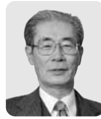
石村 栄一 公益社団法人 全国人権教育研究協議会 代表理事