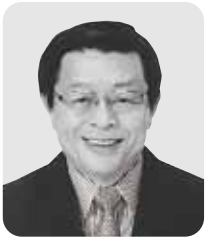
竹山 修身 堺市長