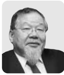
組坂 繁之 部落解放同盟中央本部 執行委員長