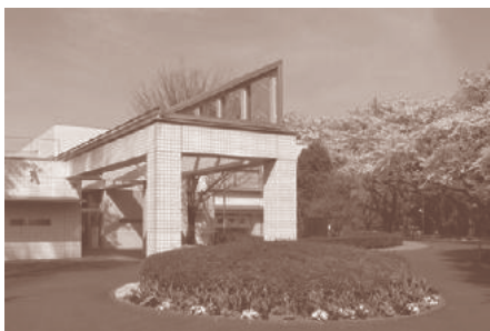
国立ハンセン病資料館