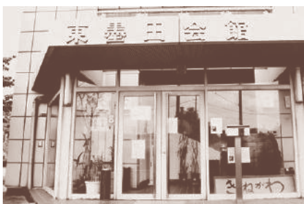
産業・教育資料室 きねがわ

東京都東村山市の東北端にある国立療養所多磨全生園。隣接する国立ハンセン病資料館は、他に類を見ないほど充実した資料をもとに、ハンセン病に対する正しい知識の普及啓発による偏見・差別の解消と、患者・元患者のみなさんの名誉回復をめざしています。現地学習では、ハンセン病の歴史を学び、実態と向き合います。