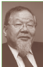
組坂繁之 部落解放同盟中央本部執行委員長

世界経済フォーラムが 2013 年に発表した男女平等ランキングで、日本は何と世界 105 位。女性議員が浴びる野次、妊娠した女性が受けるマタニティー・ハラスメントなど、問題は山積しています。女性にも男性にも生きやすい社会を、どうすれば作っているのでしょうか。女性差別撤廃条約を手がかりに考えます。