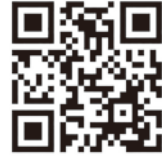
部落解放・人権研究所 ホームページ

トップページ⇒「最新の講座・イベント」⇒「第53回部落解放・人権夏期講座」⇒「内容」欄の「参加申込フォーム」から、必要事項を入力して送信してください。