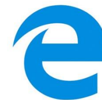
Microsoft Edge 旧バージョン

*対応しているブラウザでも、 古いバージョンだと、利用できない場合がある ので、 新しいバージョンに更新 をお願いします。